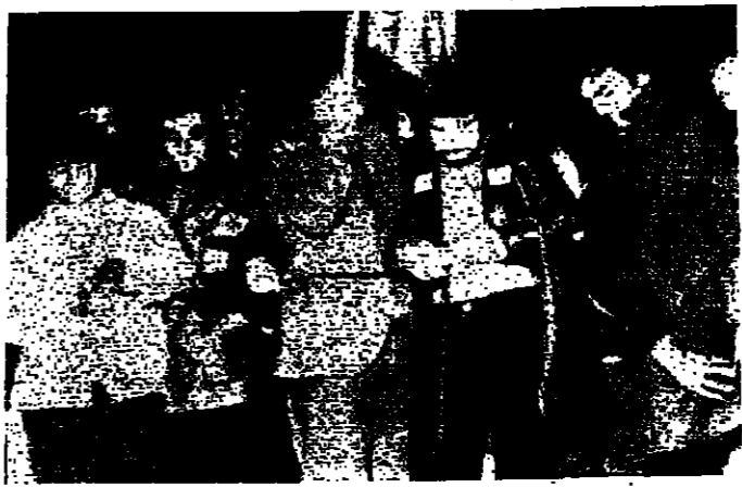
طلبة قبارصة يتظاهرون في اثينا مساء امس الاول

نيقوسيا للحدود لعرض القضية. وكان مسقطين كرامليس رئيس الحكومة اليونانية قد اتم تركيا باقتداء اعمال تصفية وغير شرعية خلافا للماهدات والقرارات الدولية. وقال ان خطوة اعلان دولة مستقلة للجزيرة التركية جاءت لتسور قول اليونان ان الهدف الوحيد للفرز التركي قبرص كان احتلال جزر كبير من الجزيرة، وتحويله الى منطقة تركية غير نوع من التقسيم.